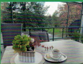
Terrasse mit Blick in den Kurpark

Da man mit der Zeit geht, ständig sich weiterbildet, renoviert und investiert ist man für die Zukunft bestens eingestellt und freut sich weiterhin auf viele Gäste.