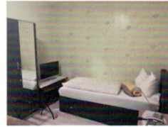
Eine kleine Auswahl der Zimmer