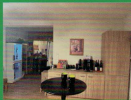
Tee- und Kaffeeküche